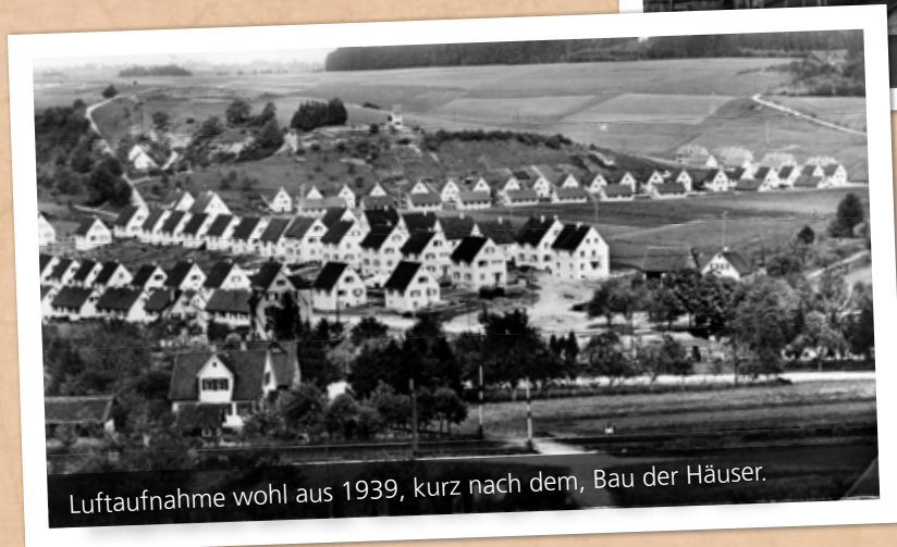
Luftaufnahme wohl aus 1939, kurz nach dem, Bau der Häuser.